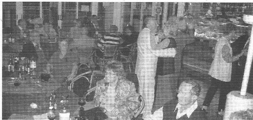
Musik und Tanz bis nach Mitternacht.