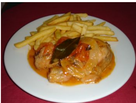
Huhn in Sauce

Einen Plan und weitere Fotos findet ihr auf der nächsten Seite. Im Internet ist der Safaripark hier zu finden: http://safariaitana.es/